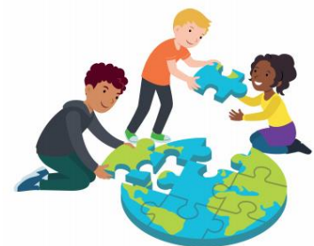
We dragen allemaal een steentje bij

Vanaf maandag gaan we werken aan een nieuw blok van de Vreedzame School. We gaan aan de slag met blok 5, "We dragen allemaal een steentje bij". De lessen van dit blok stimuleren de leerlingen een actieve bijdrage te leveren aan de school, familie of buurt.