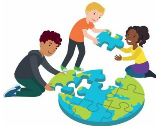
We dragen allemaal een steentje bij

We willen graag dat de kinderen zich verbonden voelen met de klas en de school. Dat kan alleen als we kinderen het gevoel geven dat ze er toe doen. Om dit te bereiken, krijgen de kinderen taken en verantwoordelijkheden. Binnen de school is afgesproken waarover de kinderen mee mogen denken en beslissen. Als de kinderen zich betrokken voelen bij de klas en de school, ontstaat een positieve sfeer. Ze zijn dan gemotiveerd om deel te nemen aan wat in de klas gebeurt.