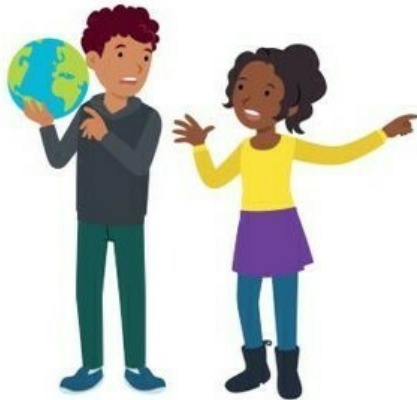
We lossen conflicten zelf op

Wij starten met de lessen uit Blok 2 (We lossen conflicten zelf op) . Het doel van de lessen in dit blok is kinderen te leren om op een positieve manier met conflicten om te gaan.