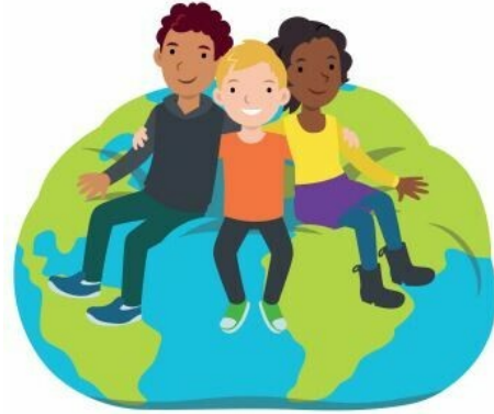
We horen bij elkaar